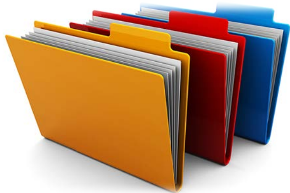
Foto de l'alumne Pla de Treball Informes alumne/A Full de seguiment. Tria de matèries Full d'entrevistes