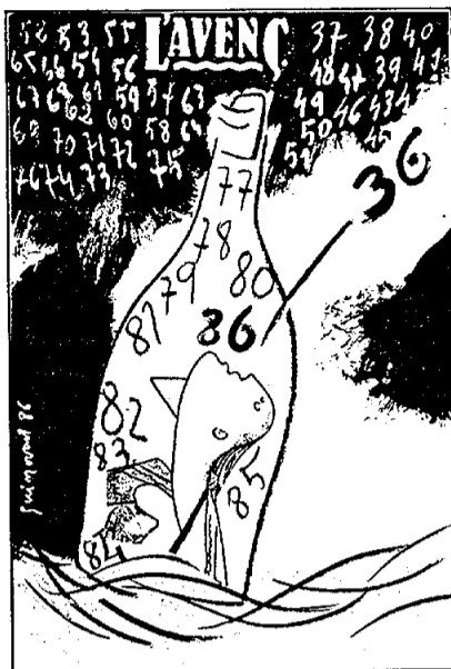
PORTADA Original de Josep Guinovart