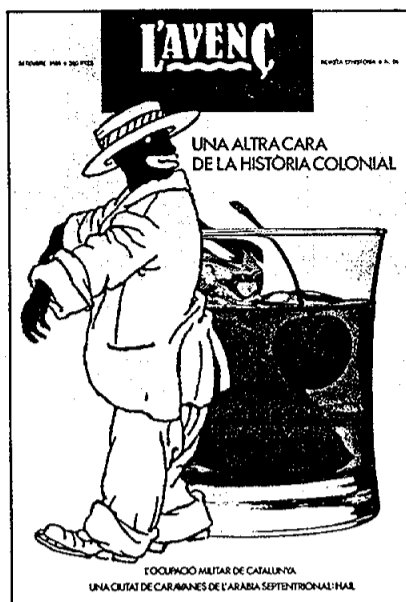
PORTADA Collage realitzat a partir d'un dibuix de Junceda