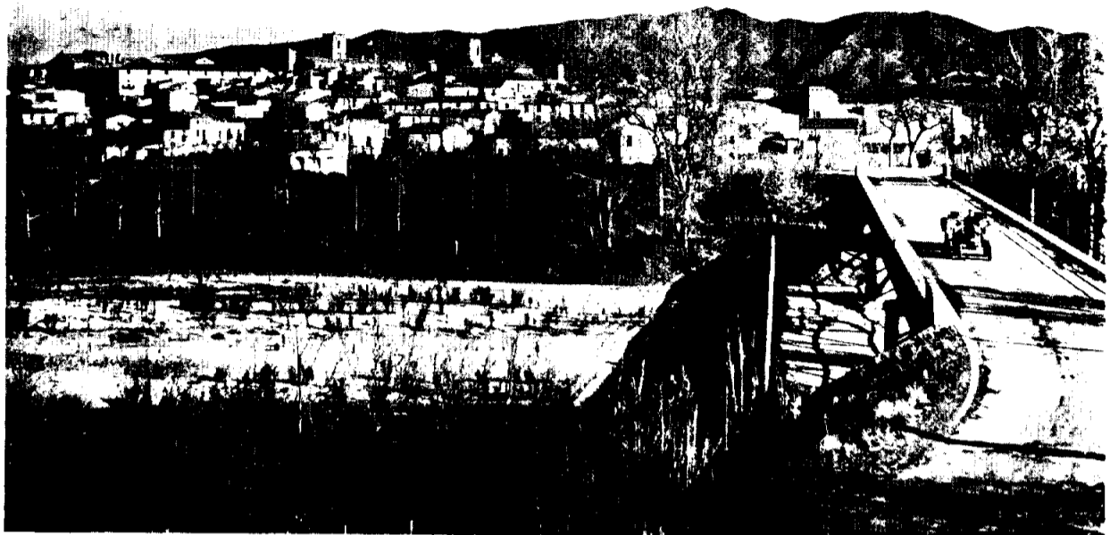
Castelló d'Empúries. - Vista parcial i pont damunt el riu Muga.