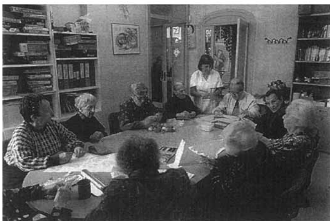
Centre de Dia.