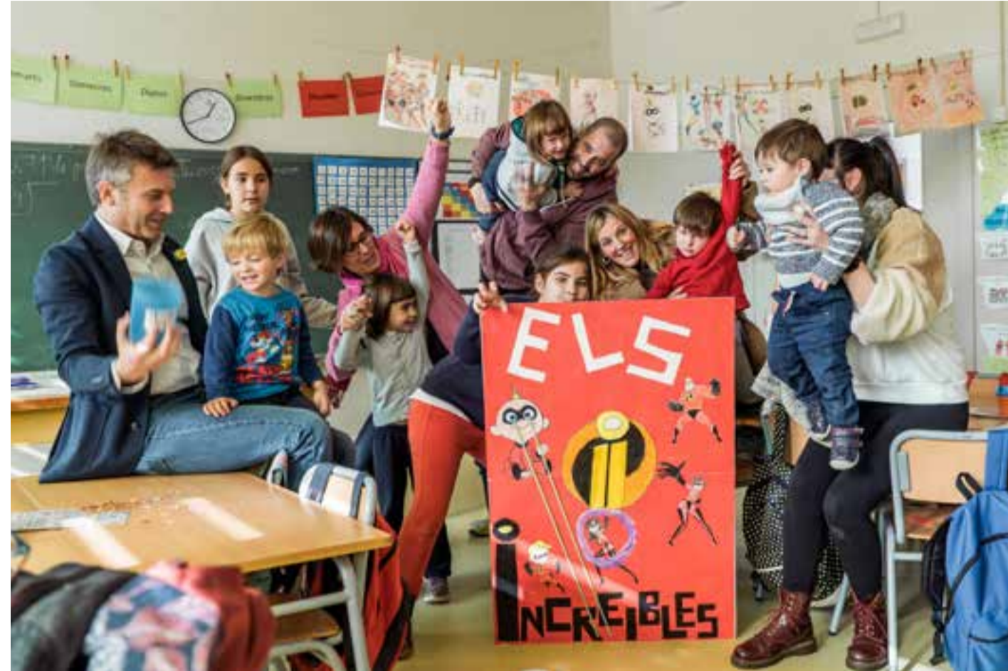
L'energia de les famílies de l'escola Pau Casals de Rubí s'encomana.

Les famílies reafirmen la seva aposta inicial per les escoles i instituts dels seus fills en veure que s'ha consolidat un projecte innovador i singular en el qual la seva participació ha tingut un paper important.