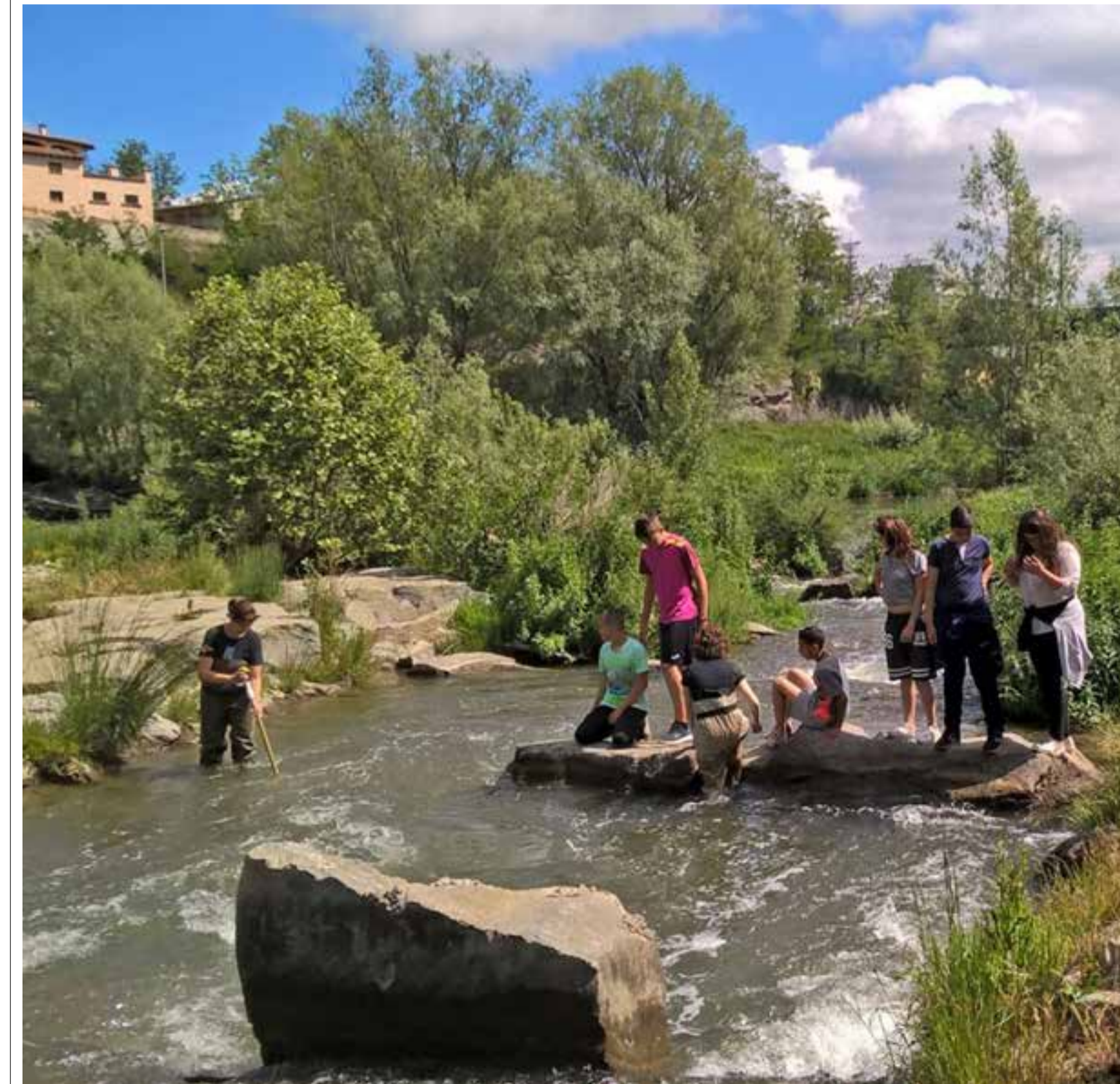
Un dels projectes més valorats pels alumnes de l'Institut del Ter és el VoraTER, que gira al voltant del riu.

Ara bé, si hi ha una iniciativa que triomfa sobre la resta és el Taulateams, que els alumnes mateix expliquen que els fa “desenvolupar les intel·ligències múltiples”. Són una mena de tallers de 30 minuts (dos dies a la setmana) que els alumnes escullen segons els seus gustos o interessos: des de coral a aeròbic, fins a corrandes, Instagram o bàsquet. Tots els alumnes participen també en el BiciTER, en què els de 4t d'ESO reparen les bicicletes que fan servir els seus companys i ensenyen com fer-ho als de cursos inferiors. “No tenim gimnàs, així que agafem el