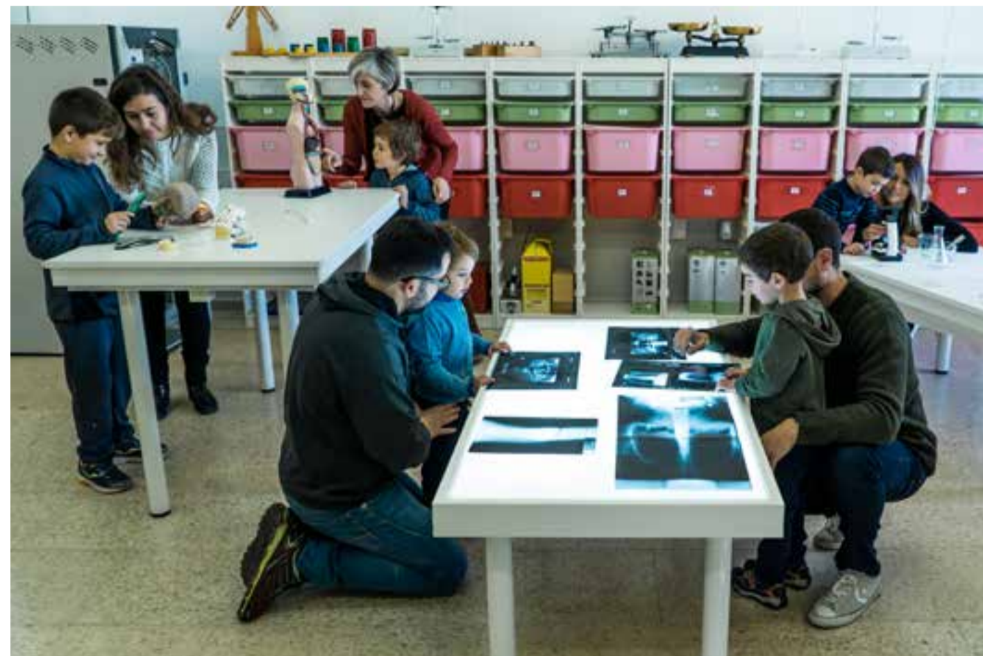
Els pares i mares de l'escola Samuntada entren sovint a les aules. Se senten com a casa.