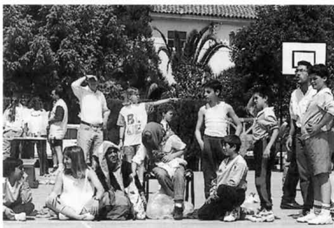
Carnaval al sector de Vila-roja.