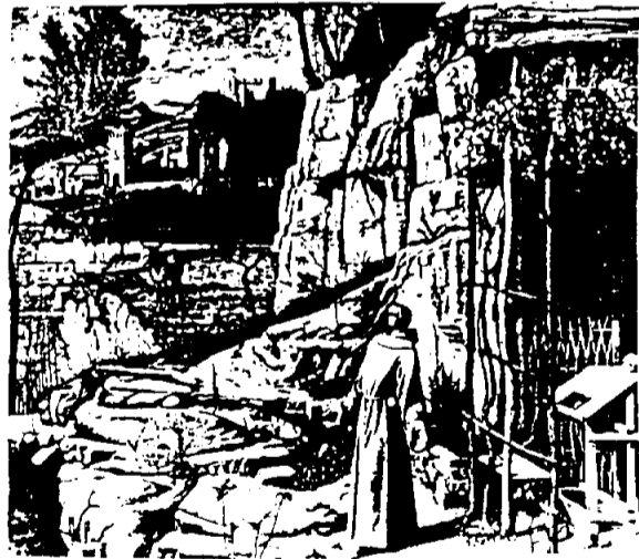
Giovanni Bellini "St. Francesc en èxtasi" (Col·lecció Frick, Nova York)

L'altra manera com es pot enfocar el tema de la vida i de la mort, consisteix a ajudar els nens a veure les diferents formes d'acabament de la vida entre les coses vivent. Algunes coses, com les fulles, simplement cauen quan estan gastades. En altres casos, les coses es moren o es maten abans d'haver tingut la possibilitat de desenvolupar-se plenament. La discussió pot ser profitosa si es contrasten les actituds que es tinguin envers aquestes diferents formes de morir les diferents coses o éssers. Et podria anar bé de mirar el capítol 8 de la novel·la Lisa , on la Suki i la Lisa parlen de la mort del pare de la Lisa, o bé de repassar aquest mateix capítol 14, quan l'Anna explica a la Suki que en Titus, el fill d'en Rembrandt, va morir poc després que el seu pare el pintés, quan tenia uns vuit anys. La Suki respon: "Pobre home, és fort perdre algú que estimes molt."