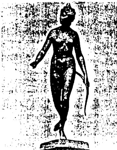
Jean-Antoine Houdon "Diana caçadora" (Col.lecció Frick, Nova York)

Les dues noies estan interessades en la peça escultòrica, i discuteixen el fet que Diana vagi sense vestits. (També pots agafar aquest tema, si et sembla que els alumnes poden treure algun profit de la discussió.) Quan ja surten de la sala, ¿per què es gira l'Anna i torna a mirar fixament la Diana, una bona estona? ¿Hi ha alguna connexió entre la manera com l'Anna sembla quedar especialment fascinada per Diana, i algunes de les coses que, més endavant d'aquest episodi, dirà i farà?