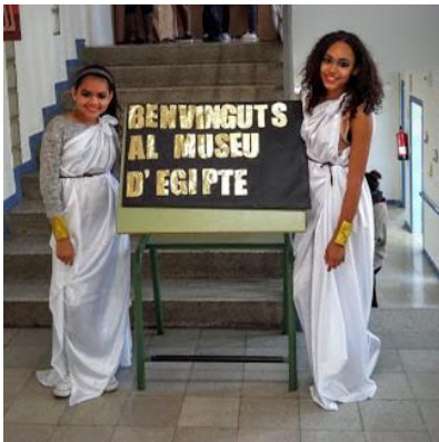
Projecte Museu Egipci