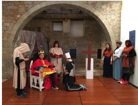
Projecte joc de cavallers