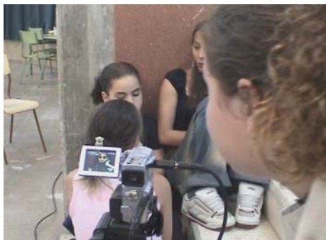
Teleduca. Educació i Comunicació. Taller de producció audiovisual.