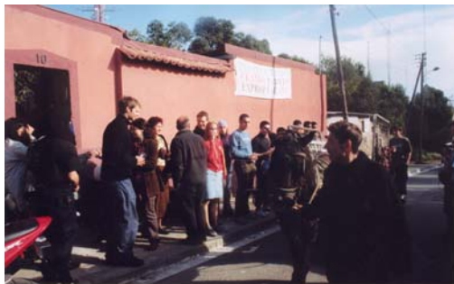
Fundació Adis. Rodatge de: "Miradas extrañas"

que no hi ha una única forma de participatives; la participació pot ser utilitzada bé com a recurs o com a objectiu. Si per exemple prenem un típic concert de música com exemple on hi ha un grup de músics que toquen i un públic que escolta, (exemple que exposa Everitt. 1997) podríem situar diferents nivells de participació en la intervenció del públic i la disposició dels músics