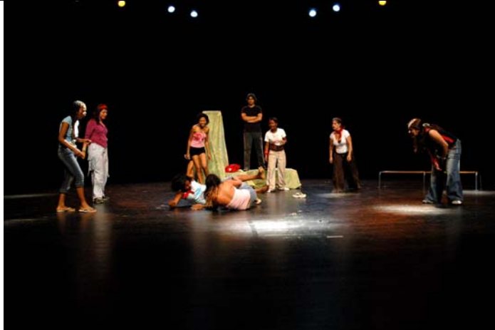
Nois i noies del Raval de Barcelona representant l'obra "Medi Ambient". Forn de Teatre Pa_tothom.