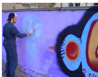
Pla comunitari Trinitat Nova. Projecte de graffiti.