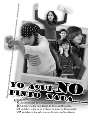
Casal de Joves de Roquetes. Projecte teatral

En els projectes promoguts per l'administració, els seus impulsors tenen assumides les diverses limitacions i són plenament conscients que en la majoria de casos no hi ha una continuïtat ni retorn per part dels nois i noies. Tot i així es creu en les possibilitats de la proposta tal i com ens assenyala un dinamitzador en una entrevista, "potser no suposarà l'encaminament dels nanos cap a unes determinades fórmules artístiques, ni els servirà per canviar substancialment la seva vida actual, però potser els ajudarà a creure en les seves pròpies possibilitats" . Val a dir, però, que si bé la continuïtat i el retorn són força limitats, la capacitat d'aquests projectes de generar inquietuds en alguns dels joves no ens pot passar desapercebuda. En ocasions s'ha donat el fet que alguns d'aquests joves, (el cas del Teatre Social n'és un bon exemple), han decidit continuar per aquesta via de treball. En definitiva, si bé la continuïtat i el retorn són limitats no podem obviar que alguns d'aquests joves, tot i les constriccions de posició que pateixen, han aconseguit fixar el seu interès en algun dels camps artístics en els que han un bon dia es van veure immersos.