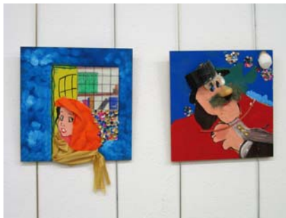
Ateneu de Sant Roc. Exposició.

Però com la possibilitat de fer cultura (ja sigui entesa com el treball de la ment individual o el treball material) exigeix la cobertura de les necessitats vitals elementals, ràpidament va passar a ser sinònim de l'activitat pròpia de les classes socials adinerades. Fer cultura demana temps, i això ha portat a que s'acabi considerant les classes benestants com les seves principals productores. La diferenciació de classe sovint està immersa en la comprensió