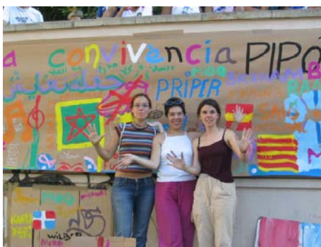
Casal d'Infants del Raval. Projecte: Barri educador