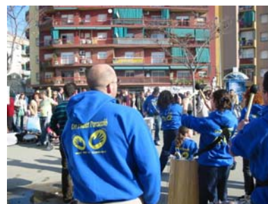
Fundació Marianao. Batucada

Per últim, la comunicació esdevé bàsica per poder generar un treball plenament participatiu. Una comunicació que s'ha de produir tan dins el propi grup de treball com entre el grup i el territori o l'àmbit on s'inscriu. La comunicació parteix de construir dinàmiques d'intercanvi en les que compartir i aprendre de la diversitat d'opinions i punts de vista tot partint de la col·laboració entre diferents persones.