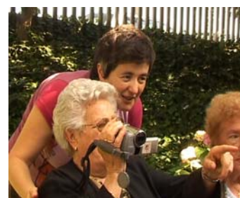
Ubú TV. Taller amb gent gran

La creativitat és una important eina de transformació social, ja que possibilita desenvolupar la capacitat per crear nous imaginaris i construir significats alternatius als que se'ns han donat. Però l'aplicació de l'art o la creativitat en el marc dels projectes d'intervenció comunitària pot prendre diferents matisos. Mills i Brown (2004) distingeixen dues maneres d'utilitzar l'art que sovint trobem aplicades en algunes propostes: per una banda, trobem l'aproximació instrumental en la qual s'utilitzen les arts com a mètode per implementar determinades polítiques i on l'art és una eina efectiva per arribar o per educar a la població. Per altra banda trobem l'anomenat rol transformatiu , on l'art s'utilitza com a procés per a permetre una determinada situació d'acció-reflexió, i com a mode important de presa de decisions i actituds. Des d'aquesta perspectiva, la finalitat última en la utilització de l'art, és la transformació. Participar en una activitat artística amb finalitats comunitàries implica (tal i com exposa Boal en el marc del treball desenvolupat al voltant del teatre social) una transformació de les persones que passen de ser espectadors passius a subjectes actius. Les arts prenen així importància com a mètode per ajudar a canviar la pròpia realitat " tot possibilitant-los la creació de representacions de les pròpies realitats, en imatge, forma i llenguatge " (Mayo. 1995: 102).