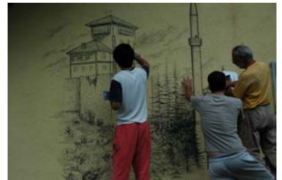
Grup d'Estudis Pedagògics. Projecte: Bòsnia