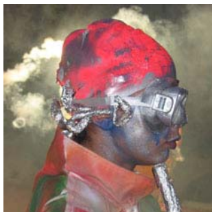
D'Aigua. Experiència a Zona Nord

Les entitats que presenten una forta incidència al territori, enfoquen el treball artístic com una eina educativa que permet treballar les capacitats d'un grup de joves i el seu entorn social. Es valoren els instruments que possibiliten aquest tipus de propostes tenint present la incidència al barri on s'inscriuen i la participació dels diferents veïns. També possibiliten construir altres formes de relació amb els nois i noies que acaben sent molt útils per les institucions educatives. El Jofre exposa un exemple des d'aquesta perspectiva: