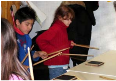
Ateneu de Sant Roc. Taller de percussió