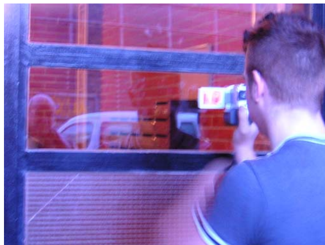
Projecte de realització d'un curt audiovisual amb els nois de l'Espai Jove del barri de Baró de Viver de Barcelona. Teleduca. Educació i Comunicació.

Experiència de realització d'un curt de ficció protagonitzat per un grup de joves del barri de Baró de Viver de Barcelona i coordinat per Teleduca. Educació i Comunicació . El curt presenta la mirada d'un grup de joves sobre el barri on viuen i la seva relació amb aquest. El procés de realització de la producció va permetre als participants reflexionar sobre la seva dinàmica de relacions tan amb el barri com amb el propi grup, treballar els hàbits i els rols dels membres del grup, així com entrar en contacte i conèixer tota la part tècnica de producció audiovisual.