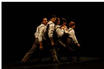
La Jarra Azul. Espectacle

Quan utilitzem la noció d'art, sovint arrosseguem una càrrega important de molts anys que han portat a situar-la en una posició poc accessible, sovint incomprensible i elitista per la majoria de la població. Els espais on majoritàriament s'ha situat l'Art, han estat espais que queden molt allunyats d'un sector important de la societat.