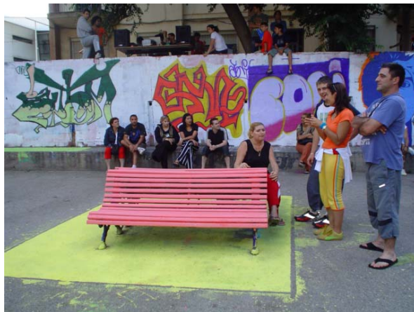
Projecte "9 barris a color". Col·lectiu Dinamo.

Proposta impulsada pel Col·lectiu Dinamo en diversos barris del districte de Nou Barris de Barcelona i que consistia en dinamitzar els veïns i veïnes del barri per mitjà de la transformació de l'espai públic. L'objectiu principal es la intervenció social en espais públics del districte de Nou Barris, en que els actors socials intervinguin, a través de l'expressió artística a l'espai públic i afavorir així la seva apropiació. Les accions que es van realitzar es desenvolupen conjuntament amb entitats i institucions del barri o bé de forma espontània. També han tingut com a estructura de referència els Plans Comunitaris com a processos o espais on donar-los continuïtat.