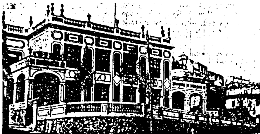
Grup escolar «La Farigola».

col·lègic, que informará sobre les aptituds especials dels alumnes que hagin de passar a les diverses facultats de la Universitat.