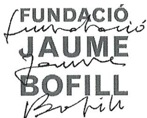
Logo Fundació Jaume Bofill