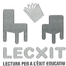
Logo projecte LECXIT