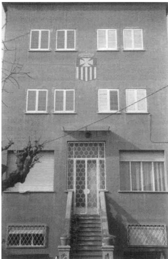
Llar Betània: una casa àmplia amb moltes possibilitats.